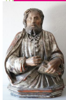
Personnages Religieux XVIIIème