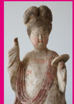
Fat Lady Chine. Tang (618 à 907)