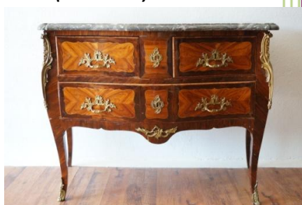
Commode Louis XV - JG SCHLICHTIG

Maître Caroline Tillie-Chauchard Contact : +33(0) 490 550 862 +33(0) 680 475 918 Email : ctc@damemarteau.fr