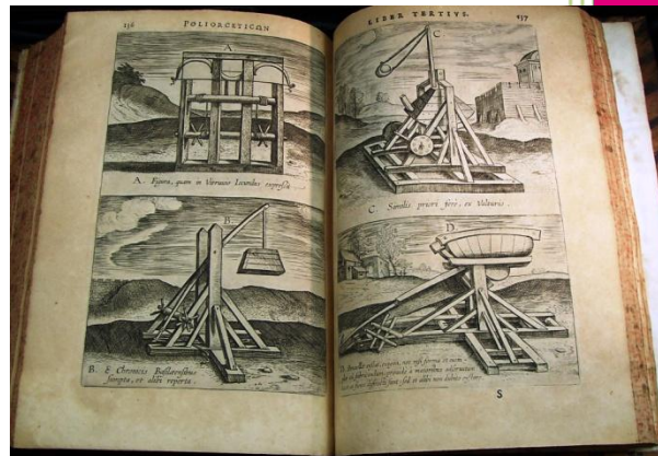
Lot N° 128 LIPSE (Juste)

Consultant Monsieur Pierre Brillard Contact : 04 90 93 25 89