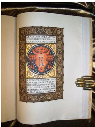
Lot N° 118 LA FONTAINE (Jean de)

Photographies et Estimations disponibles sur : www.damemarteau.fr