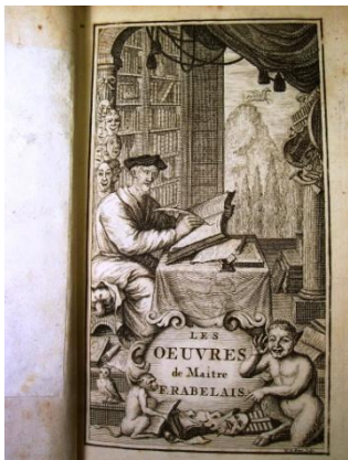
Lot N° 148 RABELAIS (François)