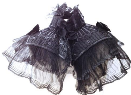
Lot N° 145 Petite cape noire en tulle et gaze