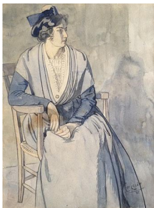
Lot N° 102 Léo Leléé : "L'Arlésienne"

Photographies et Estimations disponibles sur : www.damemarteau.fr