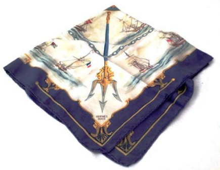
Lot N° 183 Hermès. Carré en soie imprimée titrée "La marine en bois"