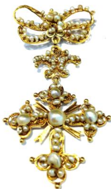
Lot N° 101 Belle croix en or jaune, entièrement ornée de perles de semences sur monture filigrané. Expert bijoux : Marlène Ledué-Crégut